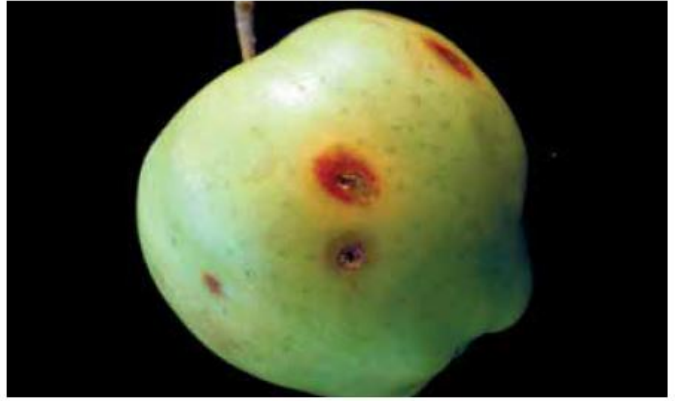
ЯБЪЛКОВ ГЛОДОВ ЧЕРВЕЙ