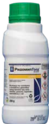
Ридомил Голд МЦ 68 ВГ 250 г