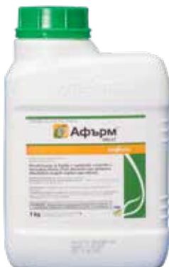
Афърм 095 СГ 1 кг