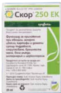
Скоп 250 ЕК 20 мл