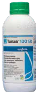
Тоназ 100 ЕК 1 л