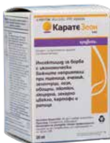
Карате Зеон 5 KC 20 мл