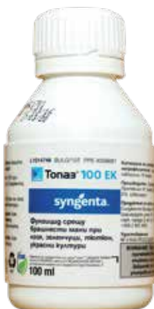
Тоназ 100 ЕК 100 мл