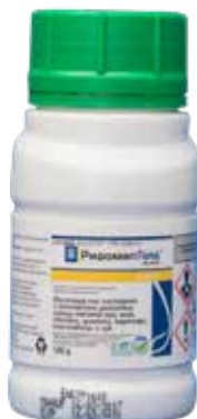
Ридомил Голд МЦ 68 ВГ 100 г