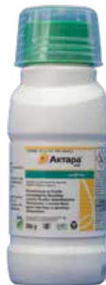
Актара 25 ВГ 250 г