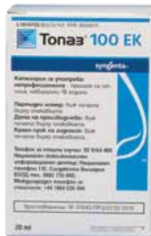
Tonaз 100 ЕК 20 мл