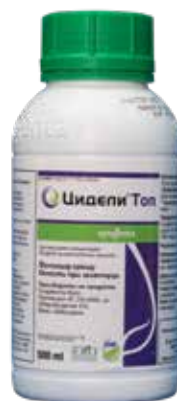
Цигели Топ 500 мл