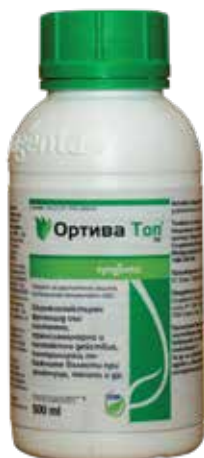
Ортива Топ СК 500 мл