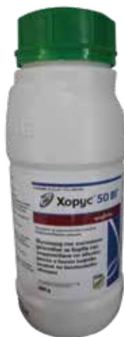
Хорус 50 BF 500 гр