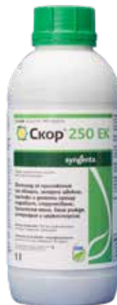
Скоп 250 ЕК 1 л