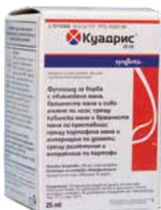
Куадрис 25 СК 25 мл