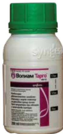
Волиам Тарго 063 СК 250 мл