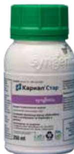
Кариал Стар 250 мл