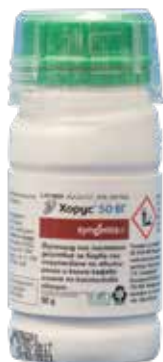
Хорус 50 ВГ 50 гр