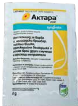
Актара 25 ВГ 4 г