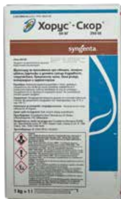
Пакет Скоп + Хорус 1 л + 1 кг