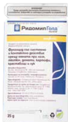
Ридомил Голд МЦ 68 ВГ 25 г