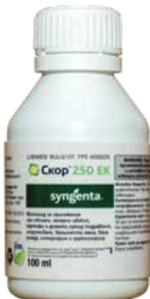
Скоп 250 ЕК 100 мл